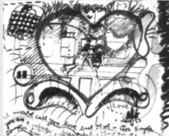
Figure 7.12 A sketch of the house shared with a partner. Excerpt from House as a Mirror of Self by Clare Cooper Marcus, copyright © 1995 by Clare Cooper Marcus, by permission of Conari Press.